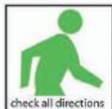
check all directions